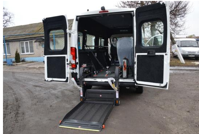
«Соціальне таксі» МКП «Сватове благоустрій»