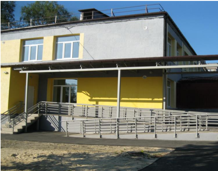
Центр розвитку дитини м. Сватове

Вхідна група дитячих садочків «Веселка» та «Журавка» м. Сватове