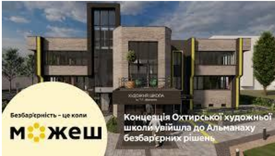
Охтирська художня школа Сумська область