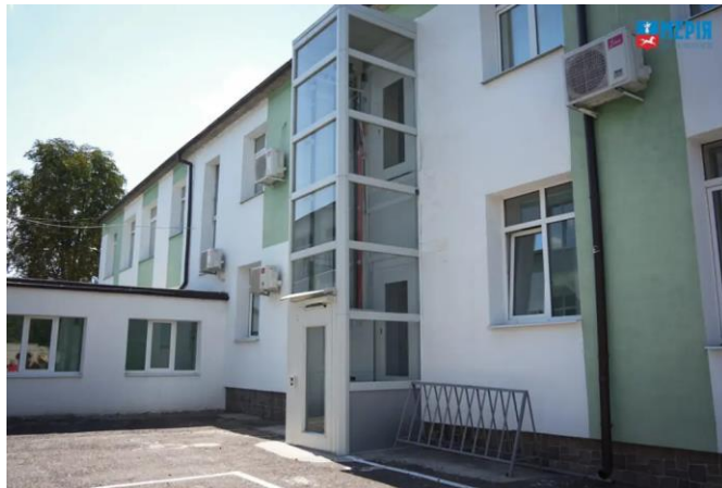
Центр комплексної реабілітації для осіб з інвалідністю "ЖАГА Життя" м. Черкаси