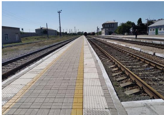
Залізничний перон ст. Сватове

Пішохідний перехід через річку Красна, (м. Сватове) дообладнаний пандусом